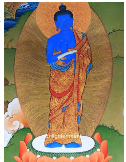
སེང་གེ་རབ་བརྟན། sèng-gué rab tèn le lion ferme et excellent

À ce monde animal y est associé un Muni au corps bleu tenant un livre. Qu'importe le contenu de ce livre, il ne s'agit pas de prêcher ou même d'enseigner la lecture aux animaux. Ce livre, emblème d'un langage élaboré par le désir d'être en lien à l'autre, est une invitation à la raison avec ses facultés de réflexion et d'analyse. Certes, la raison ne nous protège pas du danger mais elle permet d'établir un rapport judicieux face au danger. Ce livre est un plaidoyer contre la facilité de ceux, par exemple qui se résignent sous prétexte qu'ils n'arrivent pas à comprendre. Non, ce n'est pas facile de raisonner, ce n'est pas facile de comprendre. D'ailleurs, on peut estimer que la compréhension est toute subjective et que la raison a ses limites. L'enjeu reste la liberté de recourir malgré tout à la raison qui est une aptitude majeure de notre esprit.