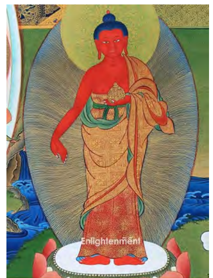
ཁ་འབར་དེ་བ། k'a bar dé wa bouche de feu

Ne demandons pas au plaisir d'assouvir à tout jamais le désir. La nature du désir est vide d'une réalité qui pourrait être atteinte. Le véritable sens du désir est d'en réaliser sa vacuité au sens où il n'y a pas de désirabilité en l'objet qui crée le désir et qui pourrait combler le sentiment d'insatiabilité. Ce sentiment vient uniquement de notre incapacité à jouir, c'est-à-dire faire usage simplement d'un plaisir voire même d'un déplaisir. Il n'y a pas lieu de combler un manque. Le manque est ressenti du fait de se refuser la vacuité du désir.