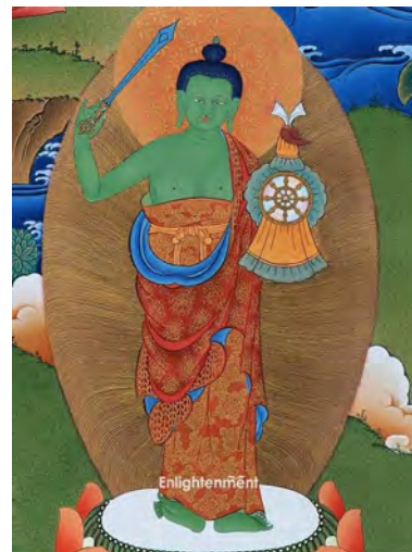
ཐགས་བཟང་རེས། t'ak zang ri le juge conciliateur

À ce monde des asuras y est associé un Muni vert, tenant une bannière de victoire et l'épée du discernement (sct. prajna). On évoque parfois une armure mais elle n'est pas représentée ici. L'épée, souvent entourée d'une flamme, illustre la lucidité qui apporte la seule victoire qui vaille, celle sur l'illusion et les distorsions (sct. klésa) et qui a pour fruit la félicité.