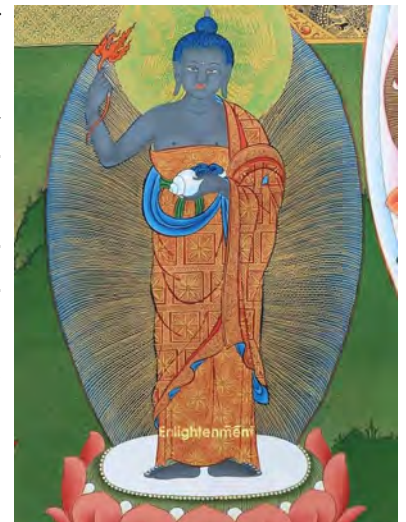
ཚེས་ཀྱི་རྒྱལ་པོ། tcheu kyi gyel-po le roi du Dharma

À ce monde des êtres des enfers y est associé un Muni couleur sombre. Il tient dans sa main gauche un bol empli d'un baume d'apaisement et dans sa main droite une flamme. Cela signifie que la lucidité apporte la paix mais aussi que l'apaisement contribue à la compréhension. Au lieu de persister dans la confrontation et de solidifier des murs toujours plus imperméables, il y a dans la haine un espace numineux d'une Intelligence qui relève de la même instantanéité qu'un miroir 5 . C'est cette espace numineux qui donne l'aspect fulgurant de certaines rédempptions.