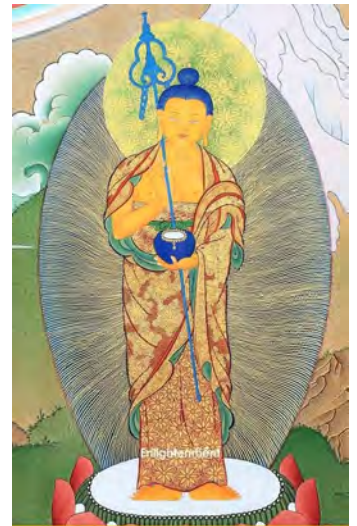
ཤཱ་ཀཧཱ་པ། sha-kya t'oub-pa le sage des Shakya

Le bâton est celui du renonçant qui se garde de nuire aux êtres en écartant les tendances fondamentales de son chemin. Le bol d'aumône n'est pas celui d'un mendiant qui réclame un dû. C'est le bol d'aumône de celui qui reste à la disposition des êtres dans la gratitude de ce qui lui est offert.